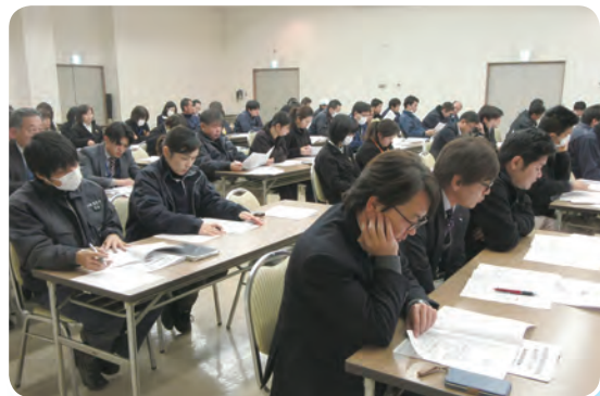
役職員一丸となって取り組みます

JAは、平成30年1月から行われるJA自己改革に関する組合員試行調査を前に、12月20日(水)全役職員が参加し、研修会を行いました。