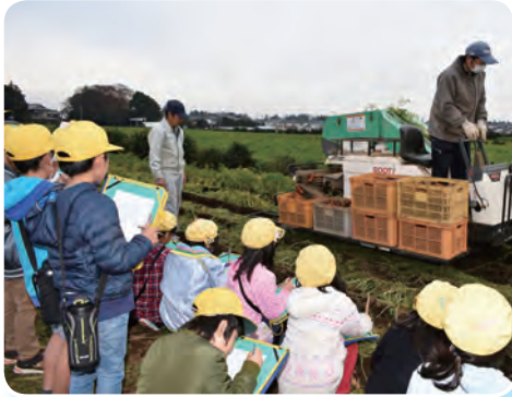
間近で見る機械は迫力満点

広い畑に入り、ニンジンが掘り上げられる様子を見た児童達は「すごい」と感嘆の表情を見せていました。