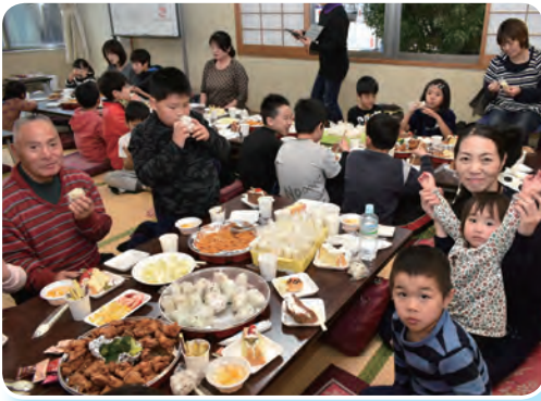
心のコもったごちそうに笑顔がいっぱい

ボランティアスタッフによって作られたごちそうと、サンタからのプレゼントに子ども達はとても喜んでいました。