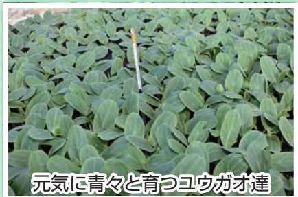
元気に青々と育つユウガオ達